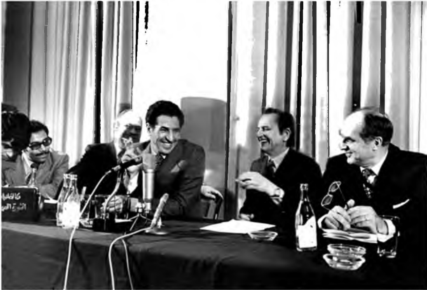
لقاء بين رئيس وزراء ليبيا عبد السلام جلود ورئيس وزراء السويد أولوف بالمه ووزير الاقتصاد في حكومته رون جوهانسون، السويد، 7 / 3 / 1974.